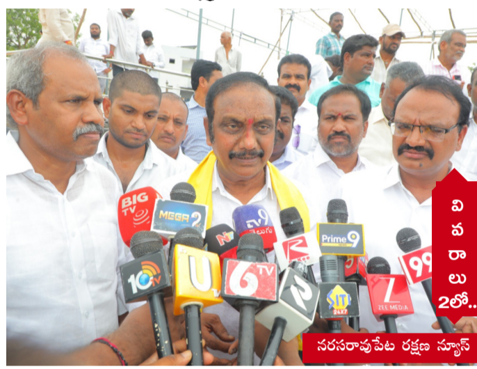
వి శ ఖ ల ు 2లో..

ఐదేళ్లలో చేయలేని అభివృద్ధిని రెండేళ్లలో చేశాం..