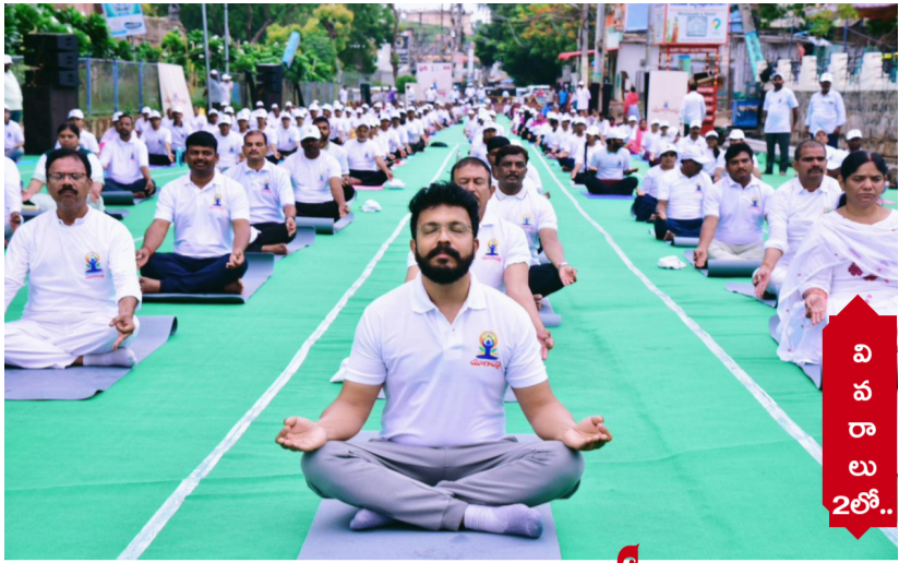
వి శ ఖ ల ు 2లో..