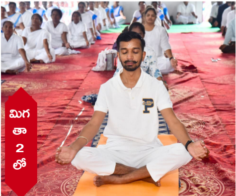
మిగ తా 2 లో