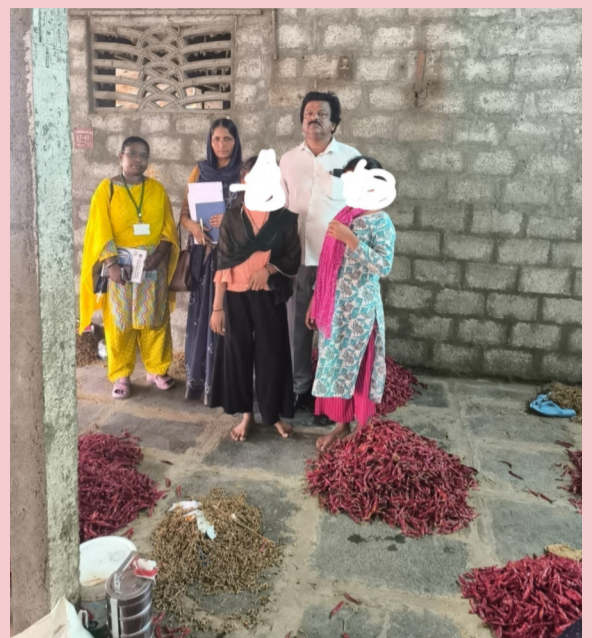
రక్షణ స్వయాస్ గుంటూరు

గుంటూరు జిల్లా కలెక్టర్ ఆదేశాల మేరకు గుంటూరు మిర్చియార్డు పరిధిలో అధికారులు శనివారం ఆకస్మిక తనిఖీలు నిర్వహించారు. ఈ సందర్భంగా యార్డులో పని చేస్తున్న ఇద్దరు బాల కార్మికులను అధికారులు గుర్తించి అదుపులోకి తీసుకున్నారు. బాల కార్మిక వ్యవస్థ నిర్మూలనకు ప్రభుత్వం కట్టుబడి ఉన్న నేపథ్యంలో మిర్చియార్డులో విస్తృత స్థాయిలో తనిఖీలు చేపట్టినట్లు అధికారులు తెలిపారు. తనిఖీల సమయంలో బాలలను పనుల్లో నిమగ్నం చేసినట్లు గుర్తించడంతో సంబంధిత వారిపై చర్యలకు అధికారులు సిద్ధమయ్యారు. బాల కార్మికులను రక్షించి, వారి వివరాలను సేకరిస్తున్నట్లు అధికారులు వెల్లడించారు. ఘటనపై విచారణ కొనసాగుతోందని, బాధ్యులపై చట్టపరమైన చర్యలు తీసుకుంటామని తెలిపారు. పూర్తి వివరాలు ఇంకా తెలియాల్సి ఉంది.