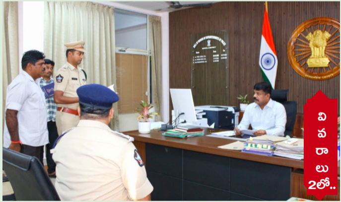
వి శ ఖ ల ు 2లో..

పోలీస్ సిబ్బంది సంక్షేమమే లక్ష్యం సిబ్బంది సమస్యలపై ప్రత్యక్ష వినతి..